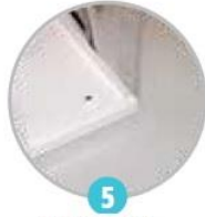
5 Integrovaná záchytná vana