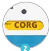
2 Kontrolní okno