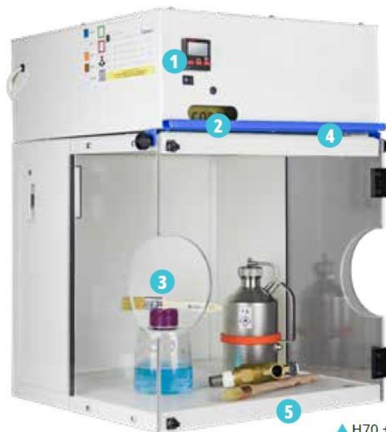
▲ H70 + CORG51