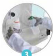
3 Otvory pro ruce